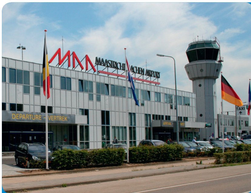
Afb. 2 - MAA staat voor Maastricht Aachen Airport

Op een grote luchthaven werken veel mensen met verschillende beroepen. Schrijf op welke beroepen dat kunnen zijn.