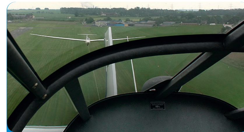
Afb. 4 - Zweefvliegtuig aan sleepkabel

Omdat vliegtuigen veel brandstof verbruiken, kost vliegen veel geld. Daarom worden alleen waardevolle zaken met het vliegtuig vervoerd en dingen die snel in de winkel moeten liggen, omdat ze anders bederven. Zo komen op de luchthaven in Luik bijvoorbeeld ook bloemen en groenten uit Israël en vis uit IJsland aan. De Luikse luchthaven is één van de grootste luchthavens voor vrachtverkeer in heel Europa (afb. 3). Omdat vrachtvliegtuigen zeer groot zijn, hebben ze lange start- en landingsbanen nodig. Eén van de landingsbanen in Luik is maar liefst 3 700 meter lang!