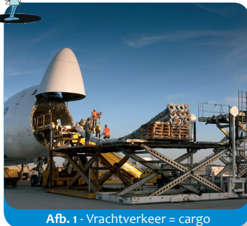
Afb. 1 - Vrachtverkeer = cargo