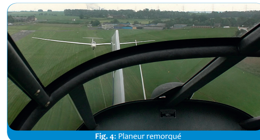
Fig. 4: Planeur remorqué

Comme les avions consomment beaucoup de carburant, le transport coûte cher. C'est pourquoi sont uniquement transportés en avion les choses de valeur et les produits périssables qui doivent rapidement arriver dans les magasins. Ainsi, l'aéroport de Liège voit souvent arriver des fleurs et légumes d'Israël ou du poisson d'Islande, par exemple. L'aéroport de Liège est d'ailleurs l'un des principaux aéroports européens à assurer le trafic de marchandises (fig. 3). Comme les avions-cargos sont très grands, leurs pistes de décollage et d'atterrissage doivent être très longues. Une des pistes d'atterrissage de Liège mesure 3,7 km de long !