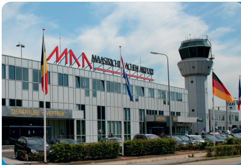
Fig. 2: MAA signifie Maastricht-Aachen-Airport