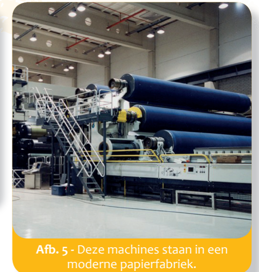
Afb. 5 - Deze machines staan in een moderne papierfabriek.