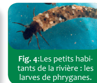
Fig. 4: Les petits habitants de la rivière : les larves de phryganes.