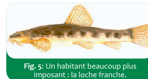
Fig. 5: Un habitant beaucoup plus imposant : la loche franche.