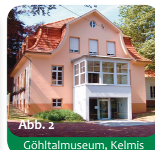
Abb. 2 Göhlalmuseum, Kelmis

Bis zur Mündung fließt die Göhl durch drei größere Orte, die bei einer Wanderung Sehenswertes bieten: Kelmis und Moresnet in Belgien und Valkenburg in den Niederlanden. In Kelmis liegt die Eyneburg, die wie eine alte Ritterburg aufgebaut wurde. Im alten Pilgerort Moresnet fließt die Göhl unter einer der ältesten und längsten Eisenbahnbrücken Europas hindurch (Abb. 3).