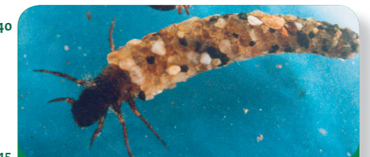
Abb. 4: Kleine Lebewesen im Wasser: die Larve der Köcherfliege.

Die Göhl durchquert das Mergelland in der Provinz Südlimburg in den Niederlanden. Mergel ist die Bezeichnung für einen sandhaltigen Kalkstein, der oft auch für den Bau von Häusern verwendet wurde. Der Mergel ist ein ziemlich weicher Stein und kann leicht abgetragen werden. Dadurch entstanden die schönen Täler und Hügel. Man nennt diese Gegend deshalb auch Heuveland , denn sie ist sehr hügelig ( heuvel = Hügel). Das ist für die flachen Niederlande sehr ungewöhnlich. Aus diesem Grund finden hier große Radrennen statt und es wird sogar Wein angebaut! Jedes Jahr kommen viele Touristen, um in Orten wie Epen (Abb. 6) und Slenaken in hübschen Fachwerkhäusern Urlaub zu machen.