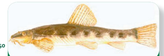
Abb. 5: Größere Lebewesen im Wasser: die Bachschmerle.

Zwischen Vaals und ihrer Mündung verläuft die Göhl sehr kurvig. Wenn ein Fluss eher langsam fließt und der Boden aus feinem Material besteht (Lehm, Löss oder Sand), können sich Kurven bilden, so genannte Mäander . Sie zeigen auch, dass der Fluss nicht künstlich begradigt wurde und sich „natürlich“ entwickelt. Ist die Göhl nun ein Bach oder ein Fluss? Sagen wir doch einfach: ein Flösschen!