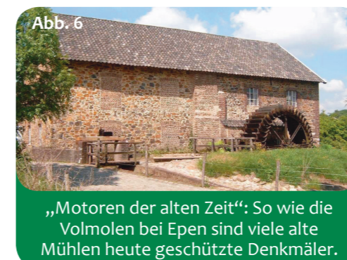
Abb. 6 „Motoren der alten Zeit“: So wie die Volmolen bei Epen sind viele alte Mühlen heute geschützte Denkmäler.