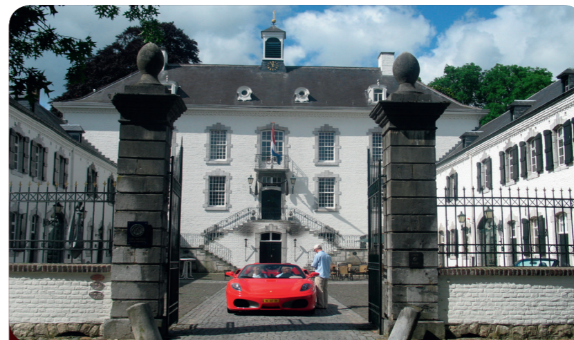
Afb. 3 - Het vorstelijke uitzicht van kastelen vraagt om een feest: bruiloften, verjaardagen, communies, enz. Bijv. hier: Kasteel Vaalsbroek in Vaals.

Ook de grachten rondom het kasteel waren er bijna alleen nog als versiering. Bij kasteel Jehay (afb. 5) in de buurt van het Belgische Hoi zijn de buitenmuren zelfs voorzien van een prachtig schaakbordpatroon. Fantastische kastelen, sommige imposant en reusachtig zoals het kasteel van de Duitse Orde in Alden Biesen bij Bilzen (afb. 6), andere sprookjesachtig zoals het kasteel Beusdael in de Voerstreek (afb. 4), hebben allemaal hun zo eigen spannend verhaal!