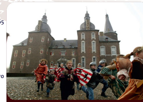
Afb. 2 - Kasteel Hoensbroek

In het Maasdal vind je veel prachtige kastelen. Je vindt ze op internet ( chateauxdelameuse.eu ), maar er is ook een mooie, kleurrijke brochure met ruim 80 kastelen ("Kastelen aan de Maas", in 4 talen).