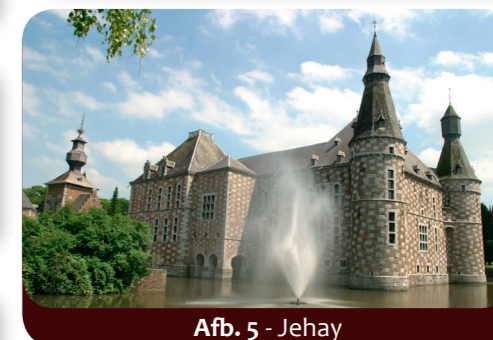
Afb. 5 - Jehay