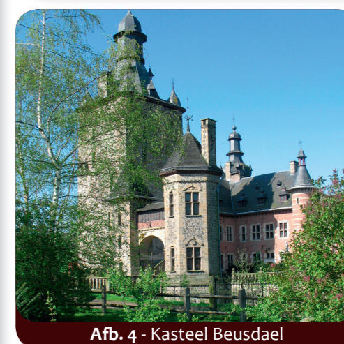
Afb. 4 - Kasteel Beusdael