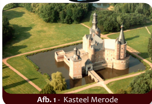
Afb. 1 - Kasteel Merode

Kasteel Merode bij Langerwehe (afb. 1) wordt nog bewoond door een echte prins. Hij heet met zijn achternaam net zoals zijn kasteel en zijn familie woont er al eeuwenlang. Het is net als alle