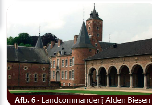
Afb. 6 - Landcommanderij Alden Biesen