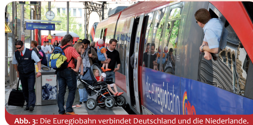
Abb. 3: Die Euregiobahn verbindet Deutschland und die Niederlande.

Und viele dieser Menschen wirken daran mit, die Zusammenarbeit noch besser zu machen. Die Bahn- und Busunternehmen haben das Euregio-Ticket erfunden (Abb. 2), damit die Einwohner der Euregio einfacher und günstiger zum Arbeitsplatz, zum Einkaufen oder zu ihrem Ausflugsziel gelangen. Die Krankenhäuser und Ärzte bemühen sich gemeinsam, die gesundheitliche Versorgung der Menschen in der Euregio zu verbessern. Polizei und Feuerwehr helfen den Kollegen in anderen Städten der Euregio, wenn diese Unterstützung brauchen. Und auch der Schutz der Umwelt ist eine Aufgabe, an der die Partner in der Euregio gemeinsam arbeiten. Damit die Zusammenarbeit möglichst gut funktioniert, erhält die Euregio zur Unterstützung Geld von der Europäischen Union .