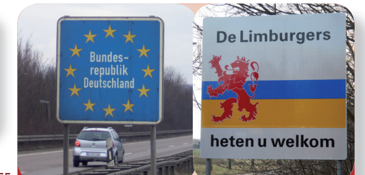
Abb. 6: Meistens erkennt man die Grenze heute nur noch an solchen Schildern